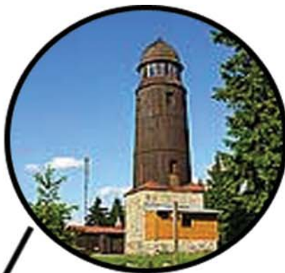
Blatenský vrch, místo našeho srazu